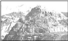
چهار قل قلاع

گروه ایرانیونج بر آن است تا در آینده نزدیک جلالستانی را با حضور اندیشمندان حوزه فرهنگ و تاریخ ایران در دفتر سالن اجتماعات امرداد برگزار کند. از خوانندگان و دوستداران تاریخ و فرهنگ ایران درخواست می‌شود تا دیدگاه‌ها و پیشنهادهای خود در این باره را برای ارسال کنند.