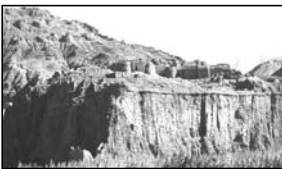
قلعه چاری زنگ، دوره چنگیز خان، افغانستان