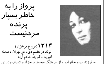
پرواز را به خاطر بسپار پرنده مردنیست