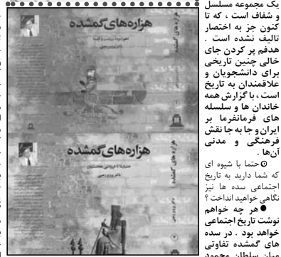
حتماً با شوه ای اجتماعی سده‌ها را به نگاشته‌اند ؟

● در این کتاب در حقیقت نامه هزاره‌های گذشته‌است و به همین سبب اسمی که برای این کتاب انتخاب کرده‌ام اسم هزاره‌های گذشته‌است و که شاید کتاب بیشتر در دله و جده و ۵۰۰۰ صفحه . کتب طوری طرح شده‌است که خواننده با مولف زندگی می‌کند و به تاریخ خود می‌گریزد .