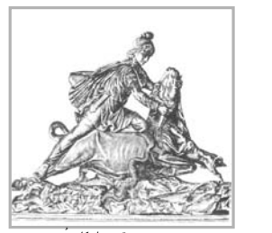
مجسمه مهرپر قمر و ائیکان-رم

مردم مویب هرمز خیار خوشبختان از میان ما رفت نام نیکو گر ماند یادگار به کز ما ماند سرای رنگار