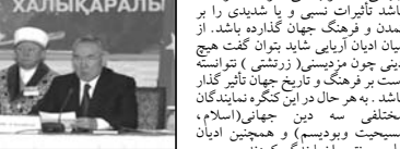
بین المللی ماندگ یونسکو و یونسف نیز در این تکرگه شرکت داشتند.

در این تکرگه ۱۷ نماینده از مذاهب، مختلف از جمله سه به عنوان ادیان مسیحیت و بودایی و به عنوان ادیان جهانی محسوب شده بودند. شرکت داشتند. این در حالی است که عقیده بسیاری از متفکرین بر این است که دینی جهانی محسوب می شود که توانسته باشد تأثیرات نسی و با شنیدنی را بر تمدن و فرهنگ جهان گذارده باشد. از میان ادیان آریایی شاید بتوان گفت هیچ دینی چون مزدیسنی ( زرتشتی ) توانسته است به فرهنگ و تاریخ جهان تأثیر گذار باشد. به هر حال در این تکرگه نمایندگانی، مختلفی سه دین جهانی (اسلام، مسیحیت و بودیسیم) و همچنین ادیان ملی-سنتی را نمایندگان کردند.