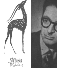
چهره ی لاغر و مصمم با عینکی درشت که قاب بزرگ مشکی دارد، چند کتاب و جمله، تنها چیزیهایی است که از صادق هدایت می ...