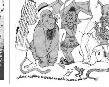
مراسم عروسی با شکوه دو هموند در دهستان ۱۱ رومانی

شاید روزی که این ۶ نفر استعفاء خود را تسلیم هیات مدیره کردند، همگی مطمئن بودند که استعفاشان از سوی هیات مدیره پذیرفته خواهد شد.